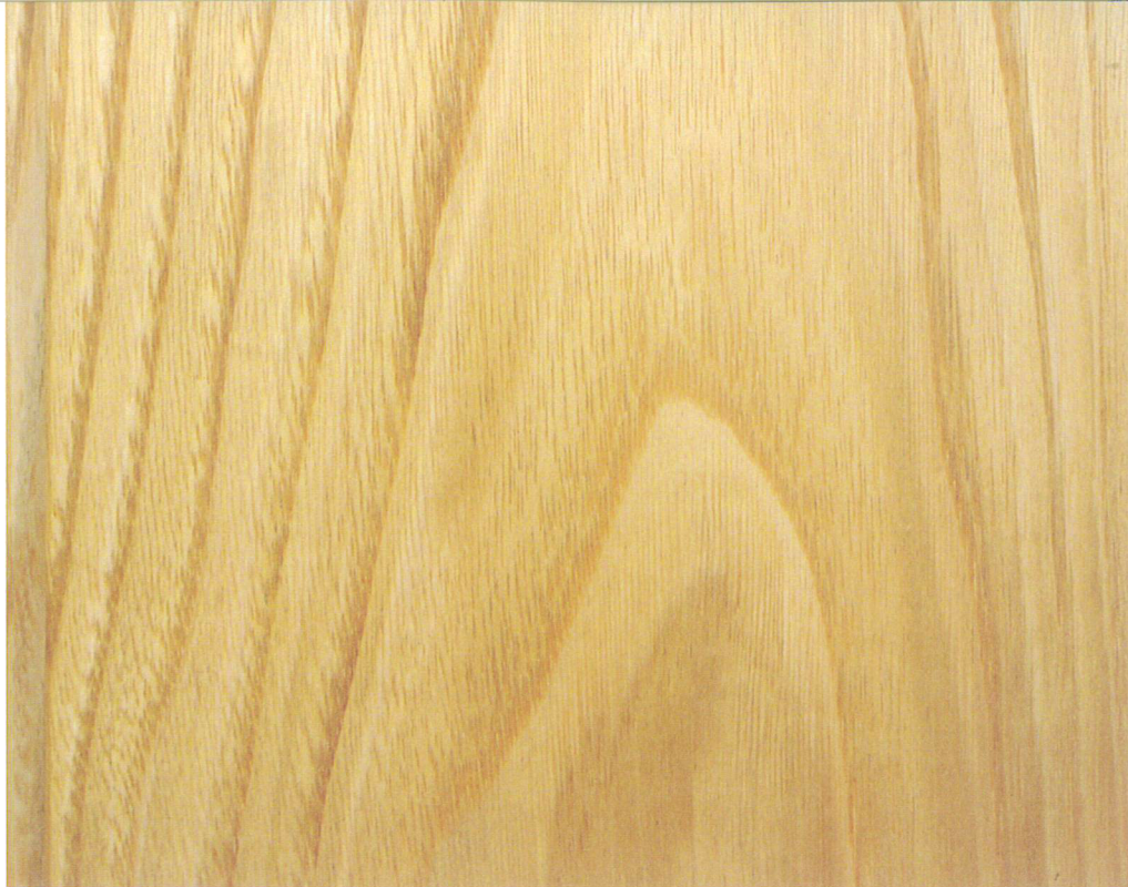
FFKS07-122 130mm巾 [1/1]