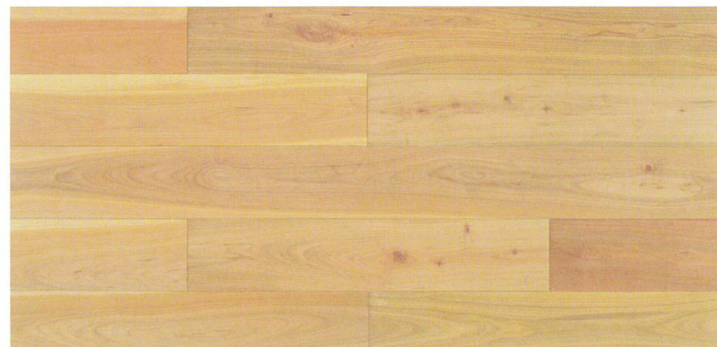
グレード: プライム&ラステック 120mm巾 FFYN05-1|2|2

「-□□□」内に入っている塗装コードは、樹種に適したおすすめの浸透性塗料です。他の塗装にも変更可能です。