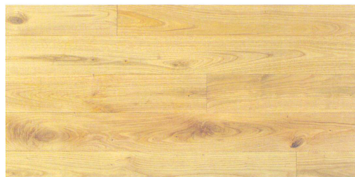
グレード: ラスティック 130mm巾 FFKN09-122