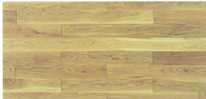
グレード: プライム&ラスティック 90mm巾 FFNN02- 1 2 2