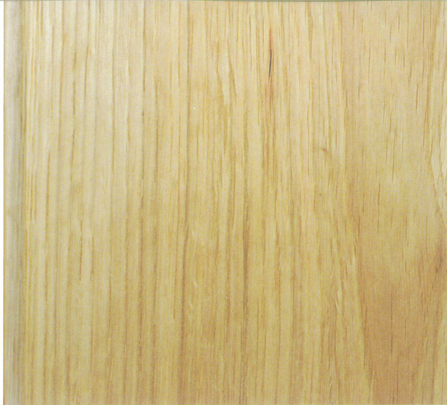
FFNN05- 1 2 2 110mm巾 [1/1]