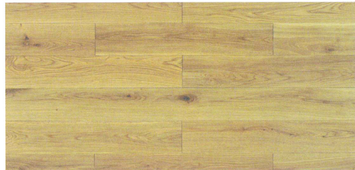
グレード: プライム&ラスティック 110mm巾 FFNN05- 1 2 2