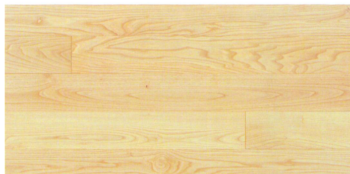
グレード: セレクト 130mm巾 FFKS07-122