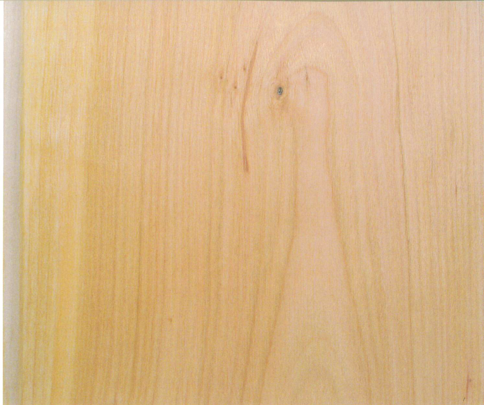
FFYN05-1|2|2 120mm巾 [1/1]